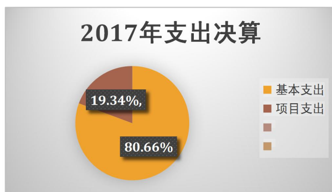
图 2：支出决算结构饼状图

本部门 2017 年度本年支出合计 724.23 万元，其中：基本支出 584.19 万元，占 80.66%；项目支出 140.04 万元，占 19.34%；